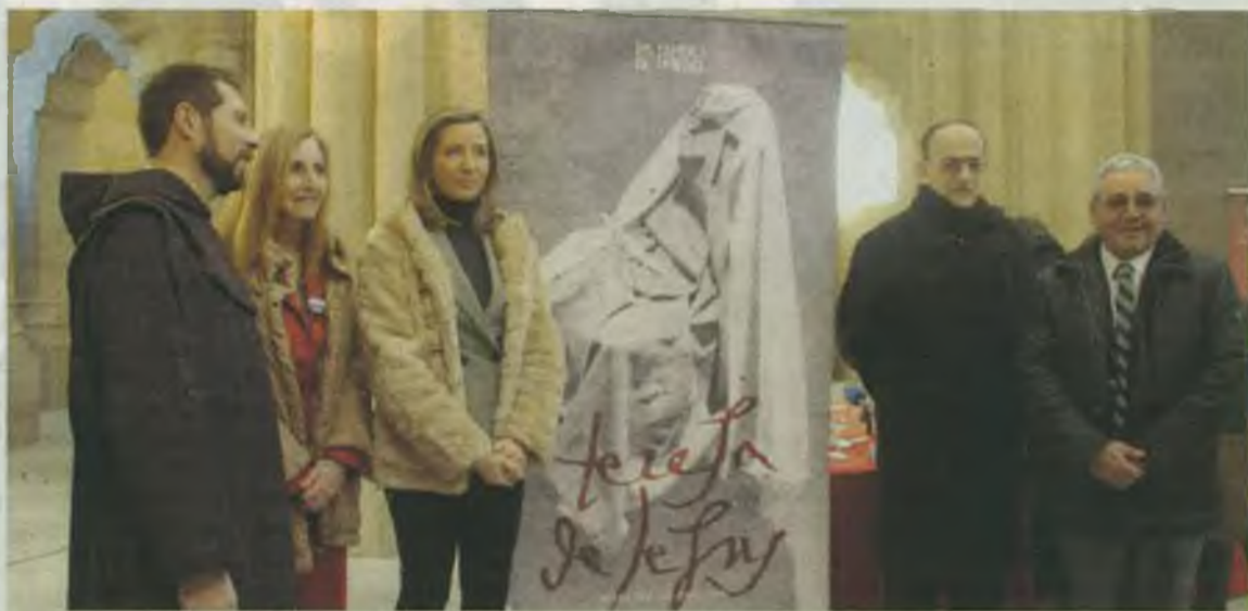
Presentación de 'Las Edades del Hombre'.