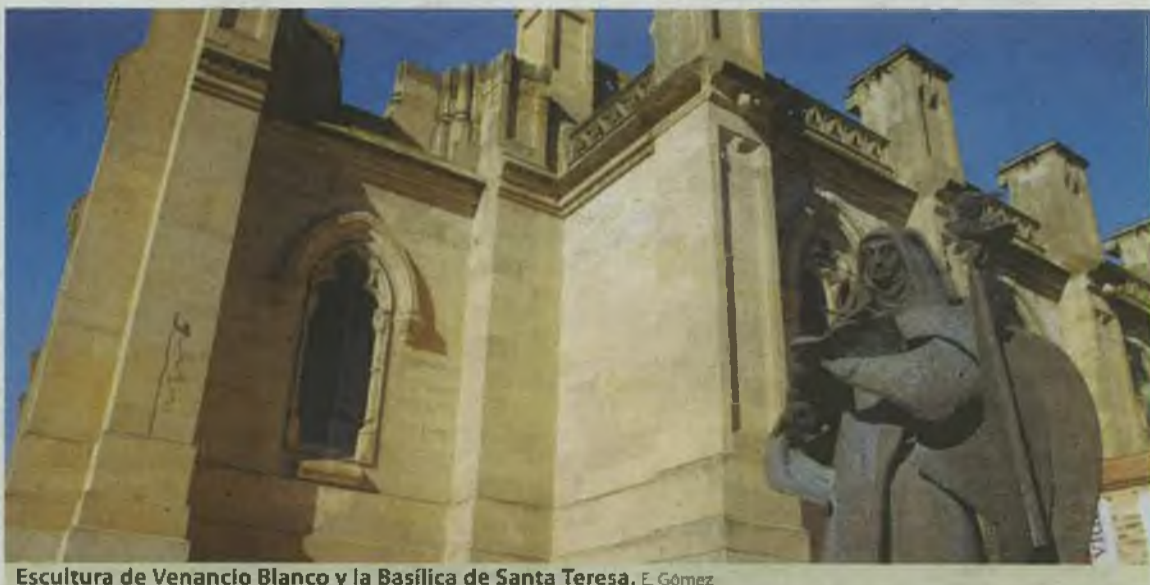
Estatua de Venancio Blanco y la Basílica de Santa Teresa. E. Gómez