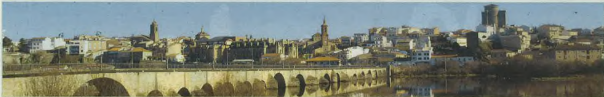
Vista parcial de la localidad salmantina de Alba de Tormes. E. Gómez

El 14 de octubre será inaugurada una estatua conmemorativa del centenario