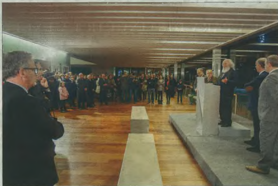
Numeroso público asistió al acto inaugural.