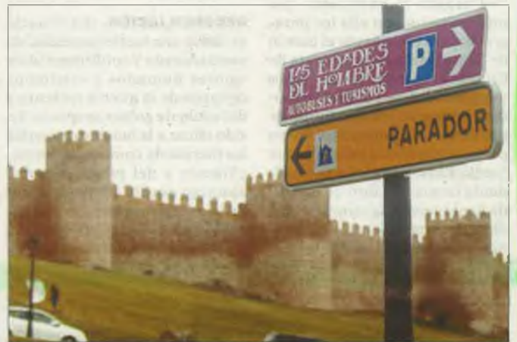
La señalización ya es visible en la ciudad.