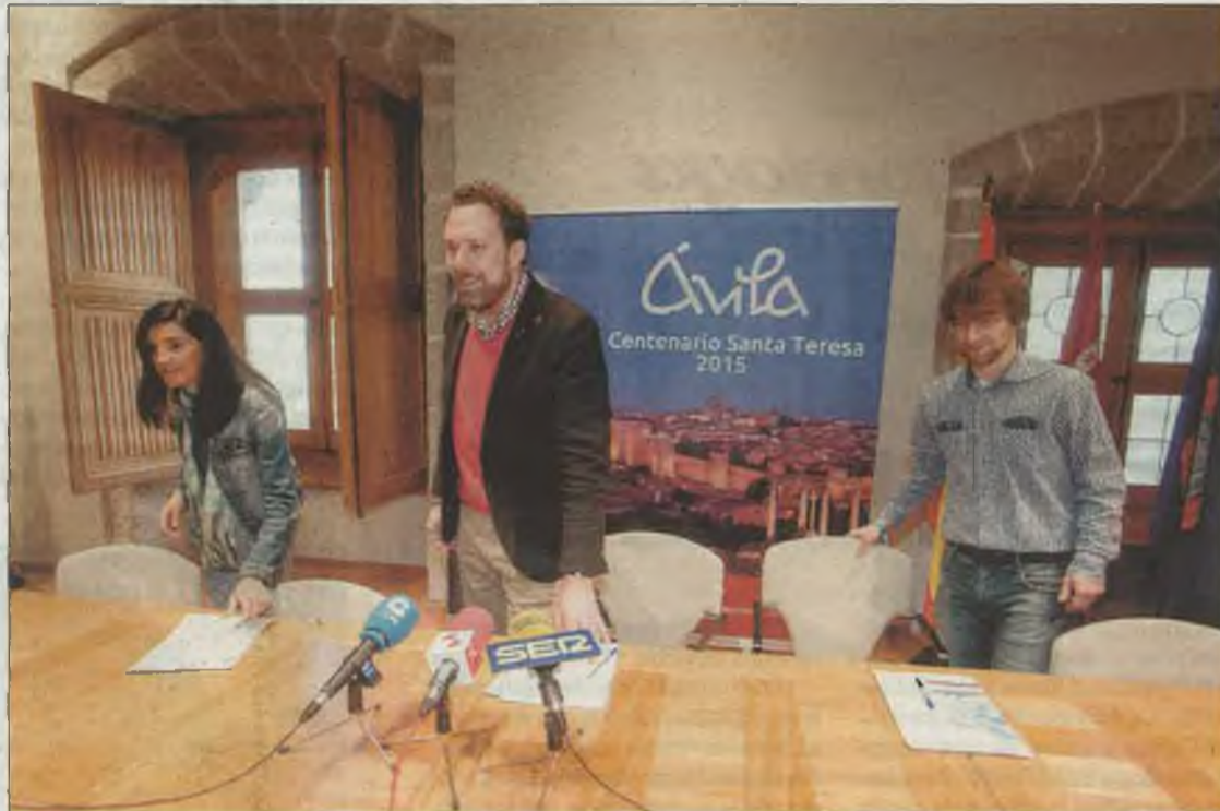
El concierto de campanas fue presentado ayer en rueda de prensa.