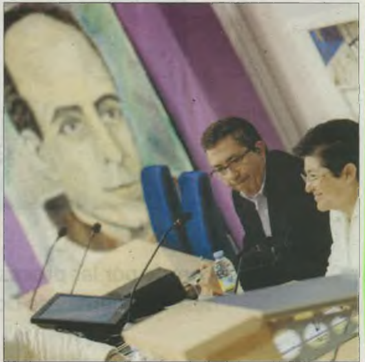
Un momento del inicio del congreso.