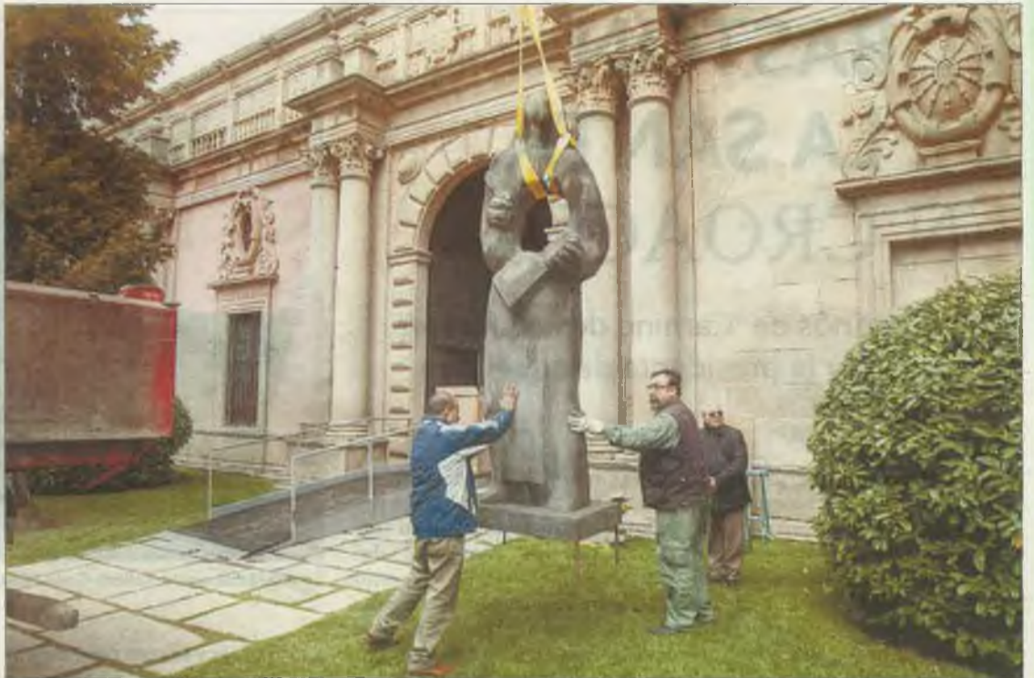
Una Santa Teresa de tres metros ya es visible en Mosén Rubí.

En cuanto a las indicaciones ya se pueden ver señales de Las Edades del Hombre que señalan el acceso al aparcamiento para turismo y autobuses que se sitúa en la parte de atrás del Lienzo Norte, además de carteles que indican la exposición y que se encuentran, por ejemplo, en la iglesia de San Juan.