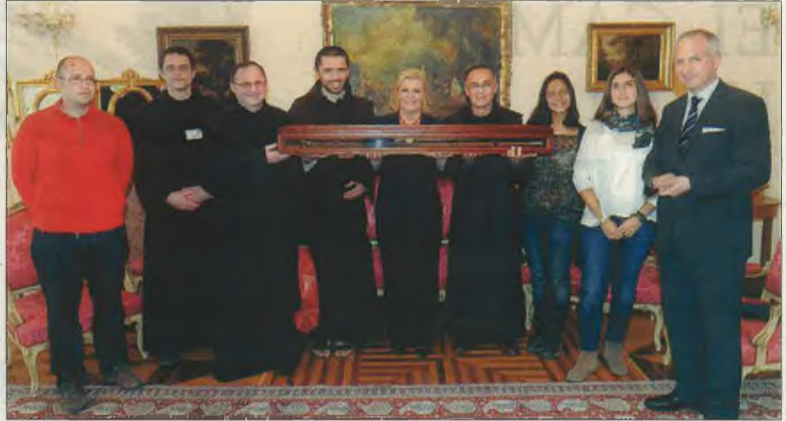
La presidenta croata, Kolinda Grabar-Kitarovic, porta el bastón, junto los peregrinos.

RECONCILIACIÓN. «En Croacia se siente una fuerte necesidad de asentamiento y confirmación de valores humanos y cristianos después de la guerra reciente y del estilo de gobierno que no ha sido eficaz a la hora de despertar las fuerzas de comunión, reconciliación y del progreso real», apuntan desde la organización de la peregrinación. Por esa razón, en la conversación con la presidenta de aquel país se le de-