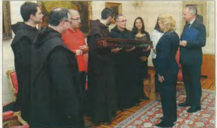
Los carmelitas explicaron el motivo de la peregrinación.

Los organizadores percibieron una cierta semejanza en la fuerza de personalidad y en la disponibilidad en defender verdaderos valores entre Santa Teresa y Kolinda Grabar-Kitarovic. El equipo de 'Camino de Luz' prometió a la Presidente la oración en tareas de responsabilidad para el bien del pueblo croata y de todos los ciudadanos de aquel país.