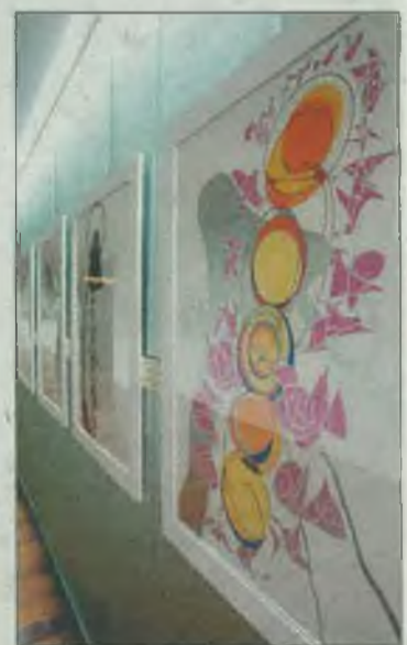
El color es el protagonista.