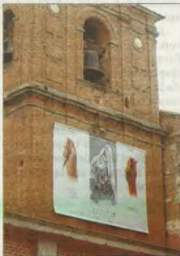
Cartel en San Juan.