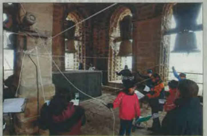
Concierto de campanas que tuvo lugar en marzo de 2014.