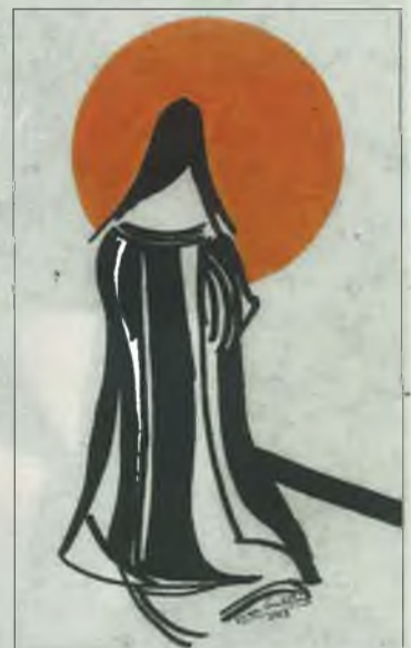
Recreación de Santa Teresa.

Siete meses largos quedan por delante para poder visitar esta exposición, en esa sala singular que está demostrando ser el Lienzo Norte, una muestra a la que el alcalde de Ávila deseó «miles de visitantes» porque «se lo merece».