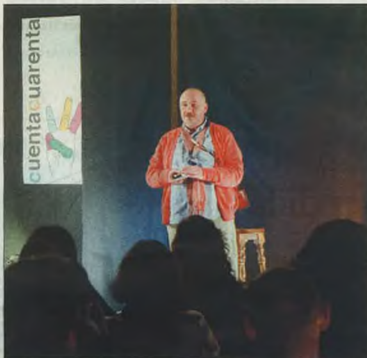
Una de las citas de la pasada edición de Cuentacuarenta.

Los organizadores advierten de que en el caso de no alcanzar dicha cantidad mínima «nos veríamos obligados a suspender el programa con el que llevamos trabajando durante meses y devolveríamos el dinero que han aportado hasta ahora casi 50 personas».