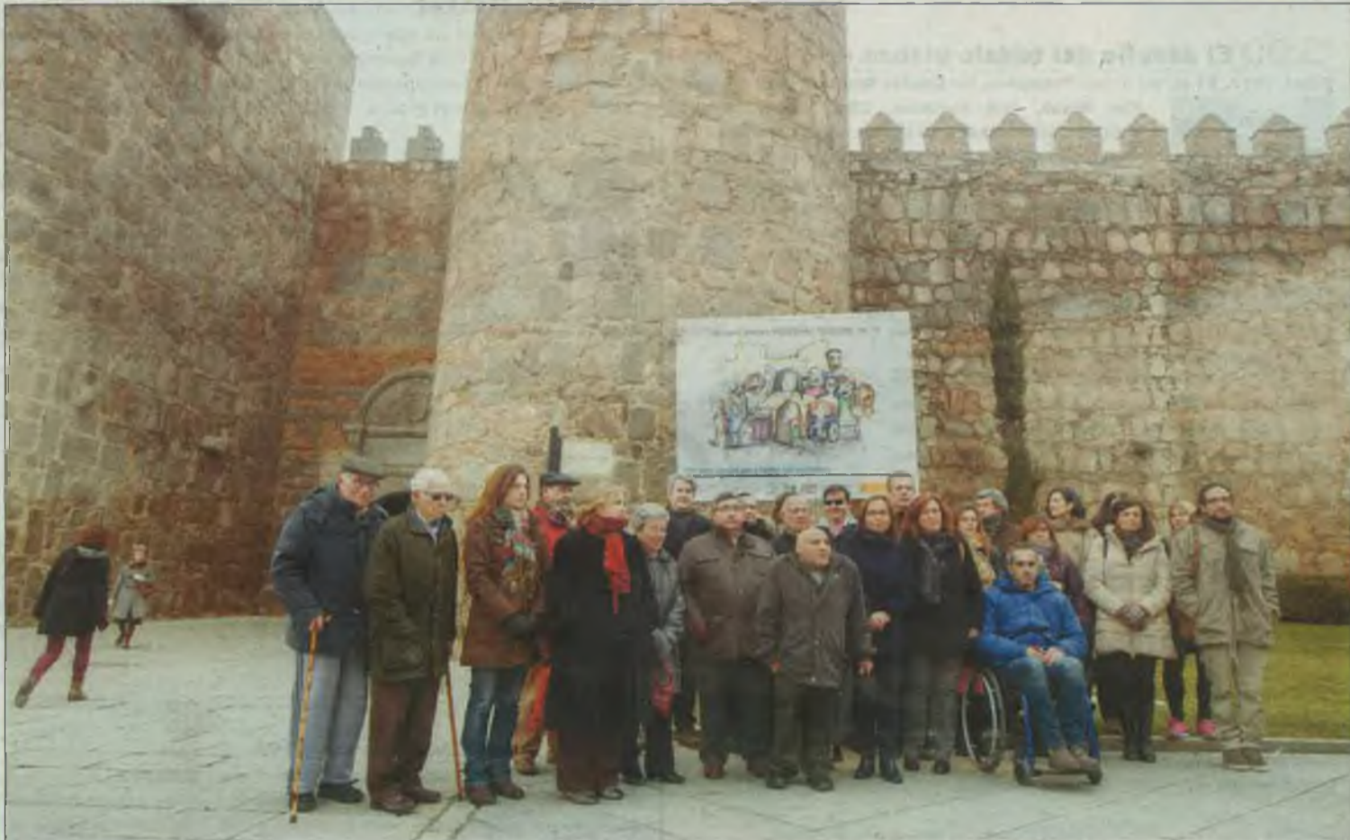
Miembros del Consejo Municipal de Personas con Discapacidad ante el último cartel de la campaña. / ANTONIO BARTOLOMÉ