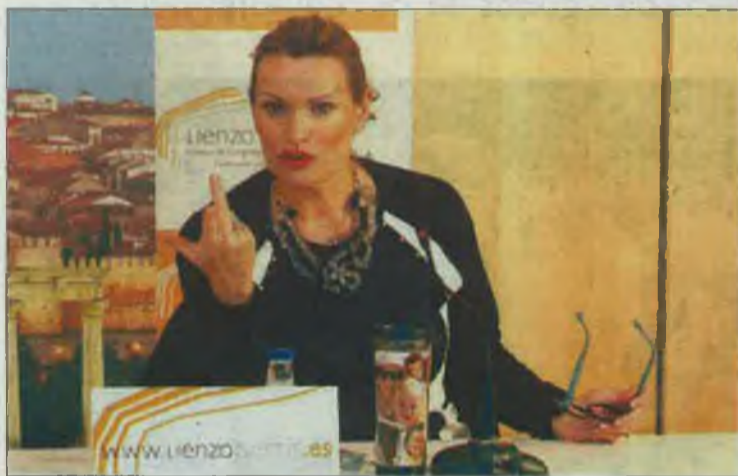
La soprano, en la presentación del recital.

Con esta idea, la solista llevará a cabo un concierto con connotaciones de «intimismo, oración, expresión pura del alma», por lo que ha realizado una especial selección para este recital en el que compartirá protagonismo con Santa Teresa, a quien está dedicado. Anunció que se vivirán «momentos místicos, de