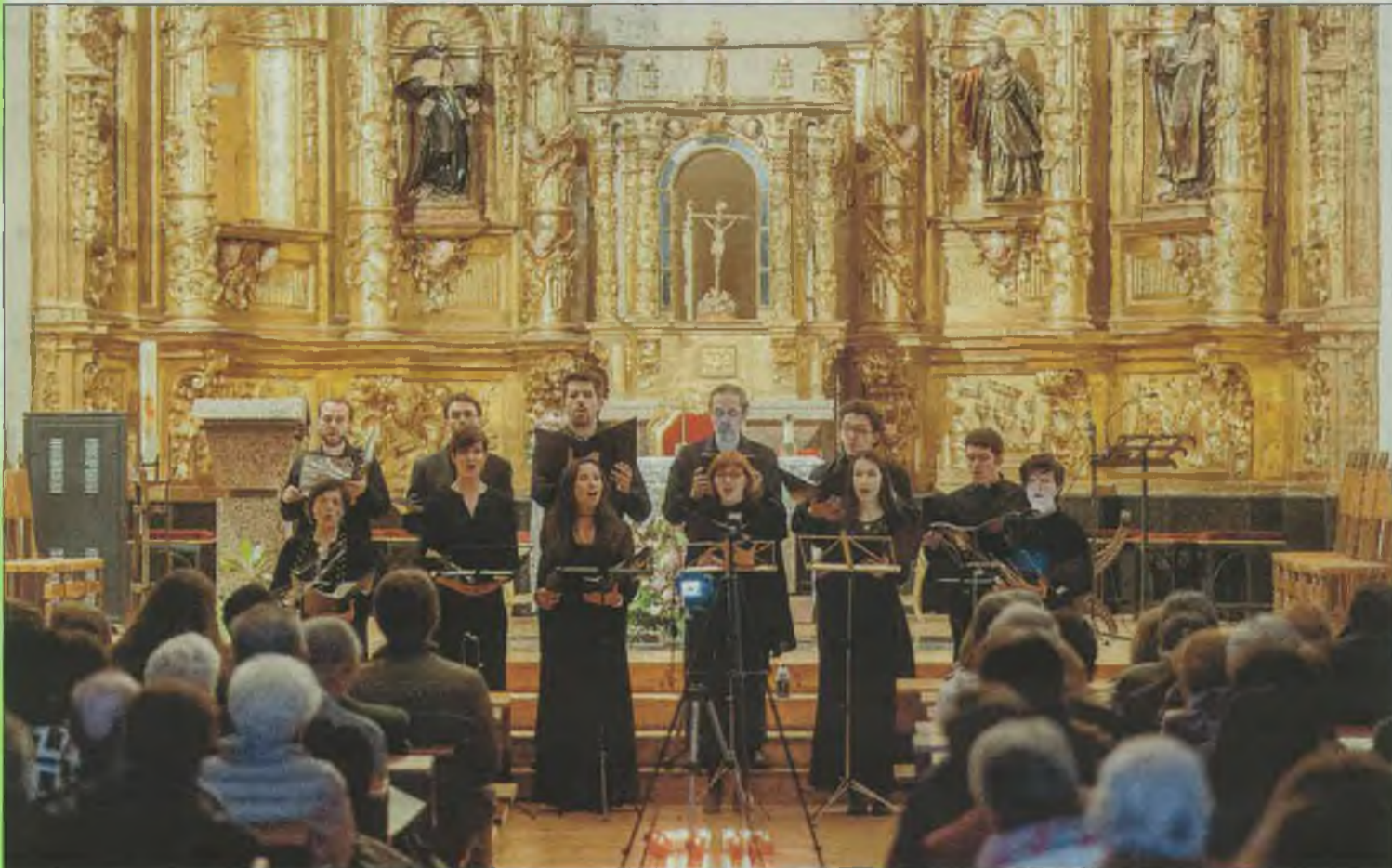
Desarrollo del concierto de 'In hora sexta'.