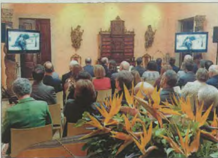
Promoción de un documental sobre Teresa de Jesús.

profesionales, prescriptores y colectivos religiosos.