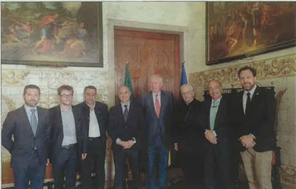
El alcalde de Ávila y el concejal de Turismo acudieron a Portugal a promocionar Huellas de Teresa.

Las acciones celebradas, dirigidas tanto al público final como al sector turístico, medios de comunicación y prescriptores, consistieron por un lado en la inauguración de la exposición fotográfica ‘Huellas de Teresa’ en el Centro Comercial Atrium Saldanha, situado en céntrica Praça Duque Saldanha, y por el que pasan cada día miles de personas que podrán acercarse a la figura de Santa Teresa a través de un recorrido por las 17 ciudades y villas donde dejó corazón y vida: Ávila, Medina del Campo, Malagón, Valladolid, Toledo, Pastrana, Salamanca, Alba de Tormes, Segovia, Beas de Segura, Sevilla, Caravaca de la Cruz, Villanueva de la Jara, Palencia, Soria, Granada y Burgos. Y, por el otro lado, la Residencia del Embajador de España en Lisboa albergó además una presentación del producto ‘Huellas de Teresa’ dirigida a autoridades,