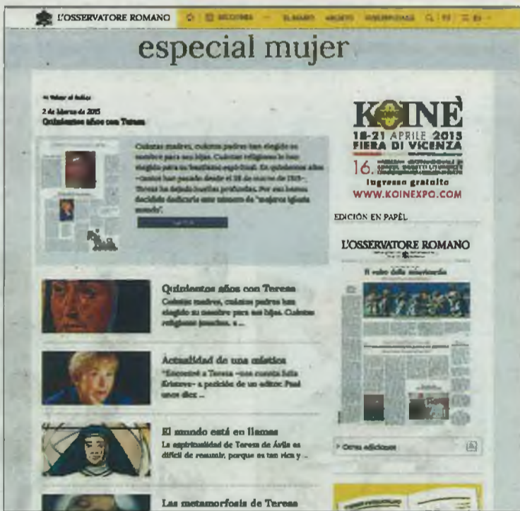
Especial sobre Santa Teresa.

En el periódico, señalan ACI y EWNT noticias, también se rescata 'Camino de Perfección', una obra donde Teresa se proyectó al futuro y afirma: «veo los tiempos