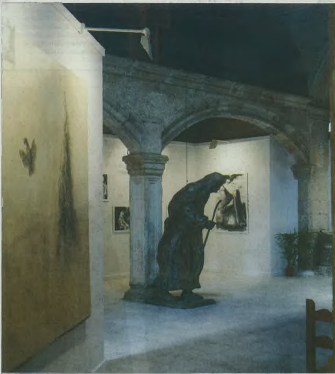
Pieza de la exposición 'Vuestra Soy - Artistas salmantinos con Teresa 2015' en Calvarrasa de Arriba.

El párroco hace las veces de guía, porque además es licenciado en Historia del Arte, y confiesa que si un grupo es «más creyente», les habla más de Dios y si no lo es tanto, pues «menos», porque al final las propias obras ya desprenden misticismo por sí mismas. Lo primero que ve el visitante nada más entrar es una réplica de un manuscrito del siglo XVI, de 1518, que constata la presencia de