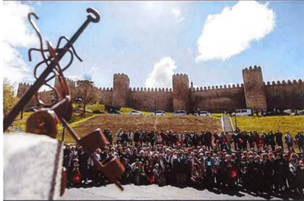
Más de 260 'Terasas' participaron en el encuentro que se desarrolló este sábado.