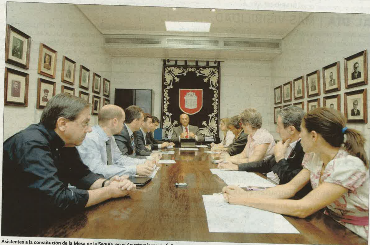
Asistentes a la constitución de la Mesa de la Sequía, en el Ayuntamiento de Ávila.